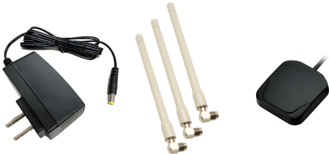
図2 付属品(ACアダプタ/RFアンテナ/GPSアンテナ)